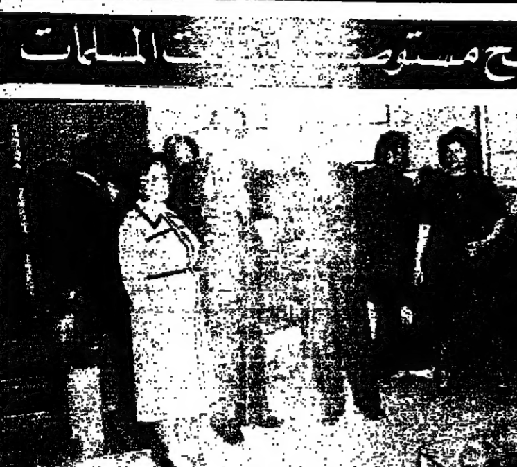
قام الرئيس سليم الحص بعد ظهر امس بفتح المستوصف التابع لجمعية السيدات في بيروت. وقد التقى الرئيس الحكومة كريمة توهيها بالخدمات الاجتماعية التي تقوم بها الجمعية، فتمت عليه رئاسة الجمعية في الصورة يسود الرئيس الحص يفتتح اجراء المستوصف والى جانبه رئاسة الجمعية والسيد عدنان الحكيم رئيس حزب التجادة

كشفت معادرت جلوبولسية، ان السلطات السورية امتنعت عن تصديق محمد الفاضل رئيس جامعة دمشق الذي اغتيل في الشهر الماضي. وقالت ان القتل هو من بين لاسراد شبكة تفتت عدة عمليات تخريب واعطوا ايضا